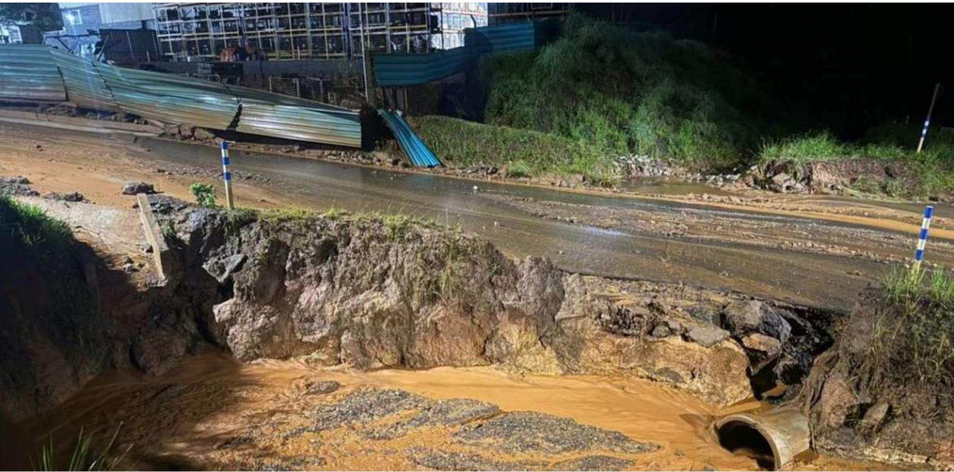
Problemas ocorreram na cidade de Congonhas.

O governo de Minas Gerais se manifestou segunda-feira (26) sobre os vazamentos em duas minas da Vale na cidade de Congonhas, no interior do estado. O primeiro problema ocorreu no domingo (25), na mina de Fábrica e o segundo na segunda-feira (26) na mina de Viga. Não houve feridos.